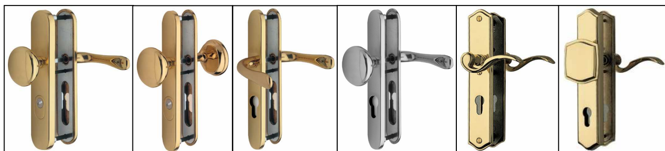
GF1 250x50x12,5-9,5 GF2 250x35x12,5x9,5 AC2 250x28x10-9,5 AC2 250x28x10-9,5 AC4 257x49x14,5-7,5 AC4 257x49x14,5-7,5 Rozteče: 72-85-110 72-85-88-90-92-110 72-90-92 72-90-92 72-92 72-92

Rozměry štítu jsou uvedeny takto: výška x šířka x tloušťka vnějšího štítu – tloušťka vnitřního štítu, údaje v mm. Každý typ kování je možné dodat takto: pouze štítky bez klik, pouze štítky s koulí, klika+klika, klika+koule, u některého typu i koule z obou stran, kde jedna otevírá a druhá neotevírá.