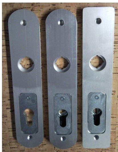
840, 849, 859 zezadu