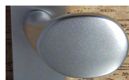
knoflík F1 940