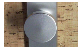
knoflík F1 960