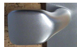
knoflík F1 950