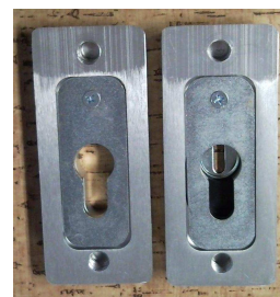
750, 759 zezadu