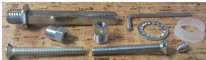
montážní materiál k sadě 840 klika+knoflík